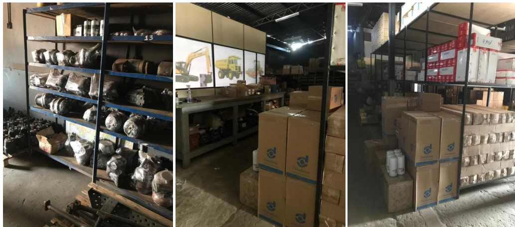
Estoques de peças - Matriz - Av. Caiapó, 1073 - Santa Geneveva, Goiânia - GO.

Rua 9, esq. c/ Rua João de Abreu, nº 192, Ed. Aton Business Stile, Sala 94-A, Setor Oeste - CEP 74.120-110 - Goiânia/GO Telefone (62) 3224-6116 - Fax: (62) 3225-7050 e-mail: masters@mastersauditores.com.br