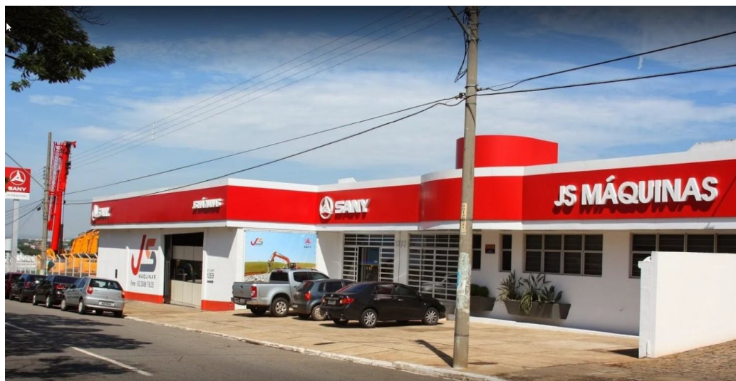
Fachada Matriz - Av. Caiapó, 1073 - Santa Geneveva, Goiânia – GO.