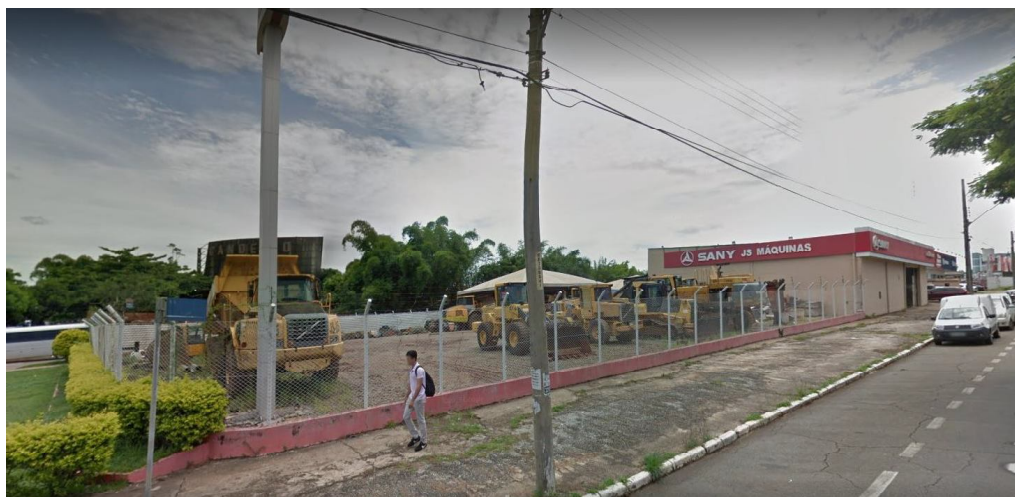
Pátio Matriz - Av. Caiapó, 1073 - Santa Geneveva, Goiânia – GO.

Rua 9, esq. c/ Rua João de Abreu, nº 192, Ed. Aton Business Stile, Sala 94-A, Setor Oeste – CEP 74.120-110 – Goiânia/GO Telefone (62) 3224-6116 - Fax: (62) 3225-7050 e-mail: masters@mastersauditores.com.br