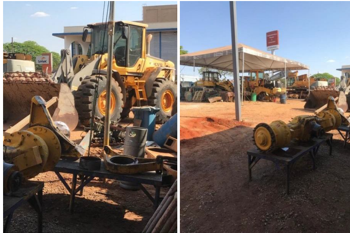
Máquinas em manutenção - Pátio Matriz - Av. Caiapó, 1073 - Santa Geneveva, Goiânia - GO.