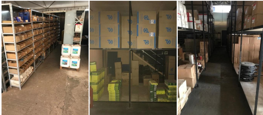
Estoques de peças - Matriz - Av. Caiapó, 1073 - Santa Geneveva, Goiânia - GO.